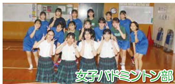
女子バドミントン部