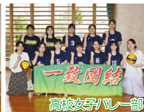
高校女子バレー部