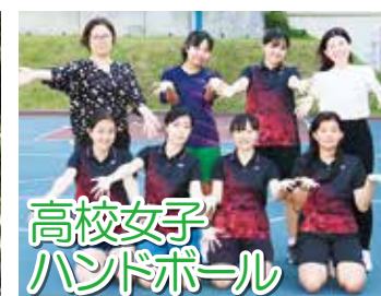
高校女子ハンドボール