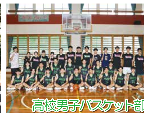
高校男子バスケット部