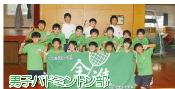
男子バドミントン部