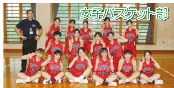
女子バスケット部

一歩早い 高校部活のスタートができます！ もちろん、違う競技にチャレンジするのもあります！