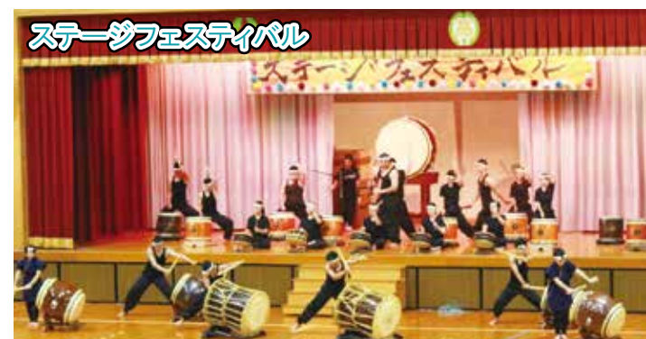
ステージフェスティバル