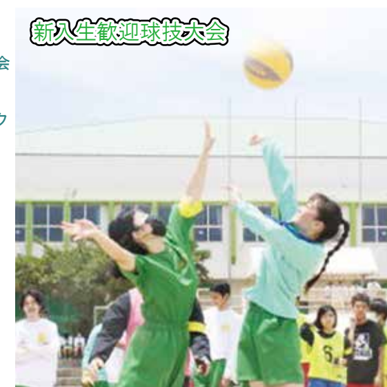
新入生歓迎球技大会