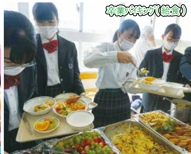
卒業パティンガ(給食)