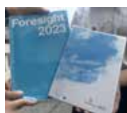
左:フォーサイト (中1)