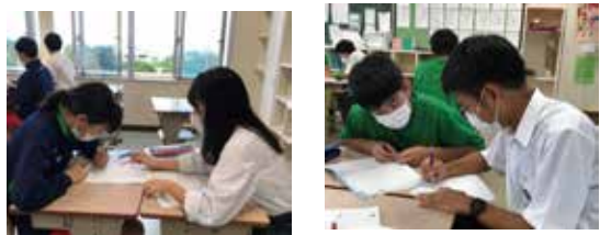
ピアチューターの様子

高校生が中学生のピアチューターとして学習を支援☆≡高校生にも中学生にも勉強になります♡