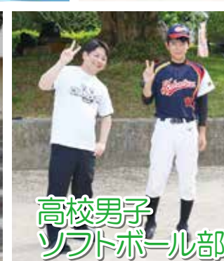
高校男子ソフトボール部