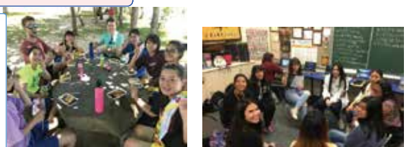
カテナハイスchool交流 ▲

★県内ALTの先生方とのイングリッシュ・キャンプ ★カテナハイスchool交流 ★韓国高校生との交流 ★などを実施