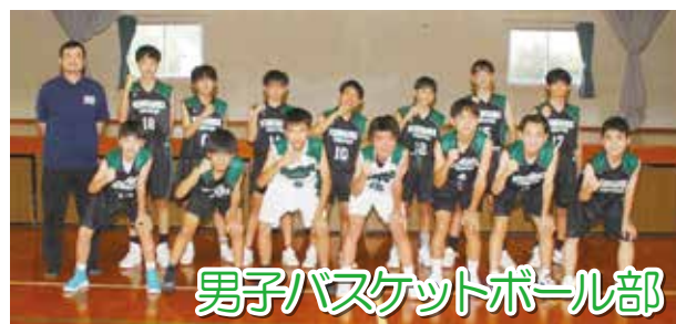
男子バスケットボール部