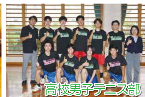
高校男子テニス部